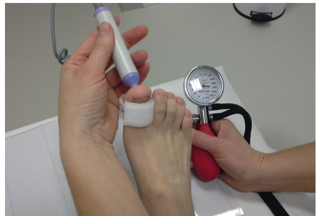
Abbildung 3: Dopplersonographische Arterienverschlussdruckmessung am Knöchel (links; Knöchel-Arm-Index [ABI]) und alternativ an den großen Zehen (TBI, Zehen-Arm-Index) z. B. bei einer Mediakalkinose (rechts).