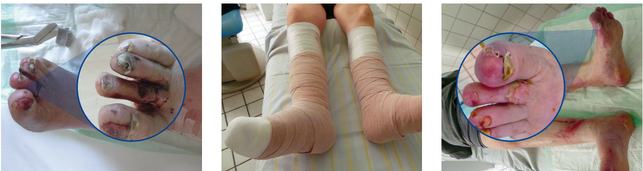
Abbildung 4: Kompressionstherapie bei koexistierender PAVK. Fallbeispiel eines Patienten (71 Jahre, männlich) mit Lymphödem, kritischer PAVK und Herzinsuffizienz vor (links), während (Mitte) und nach einer komplexen physikalischen Entstauungstherapie (KPE, rechts) mit komplikationsloser Ulcus-Abheilung und Anstieg des tcpO 2 .

In allen Fällen wurden eine Entödematisierung und Anstiege des tcpO 2 erreicht. Amputationen mussten nicht durchgeführt werden und Ulzerationen heilten ab; der klinische Verlauf war bei allen 19 Patienten erfolgreich. Es traten keine Komplikationen auf und die Kompressionsmaßnahmen wurden gut toleriert. Diese bislang noch unveröffentlichten Daten weisen darauf hin, dass die Kompressionstherapie auch bei schwerwiegenden Formen der PAVK sicher und wirksam ist. Wissenschaftliche Multi-Center-Studien zum MKS insbesondere bezüglich Compliance, Effektivität, Verträglichkeit sowie An- und Ausziehkraft sind wünschenswert.