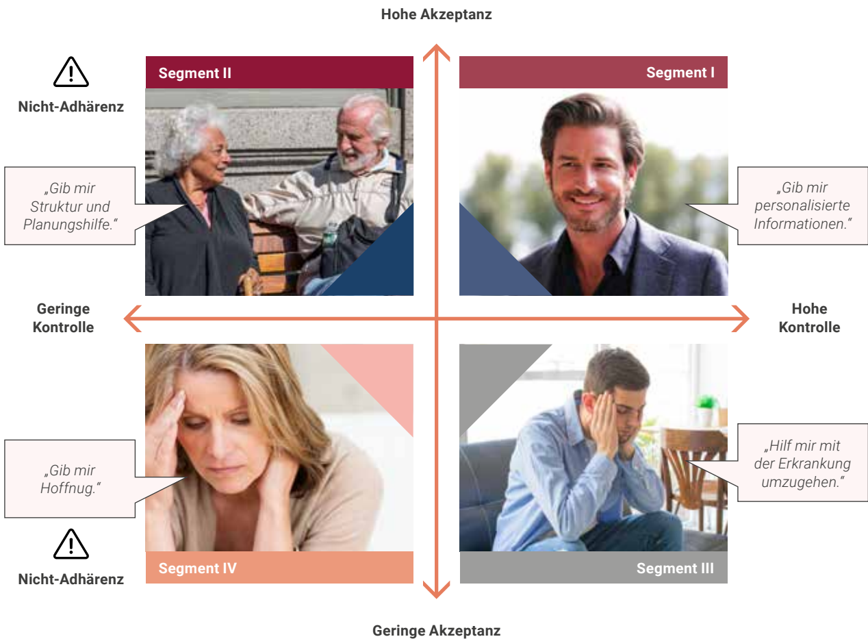
Abbildung 2: Das Segmentierungsmodell – vier Typen von Patient*innen und ihre Bedürfnisse; modifiziert nach [Bloem und Stalpers 2012, Bloem et al. 2020].

Personen in diesem Segment sind durch Passivität, Trägheit, Niedergeschlagenheit und Hoffnungslosigkeit charakterisiert. Es besteht das Bedürfnis nach persönlicher Führung und echter Betreuung. Die wichtigste Unterstützung ist daher die persönliche Beratung, bei der die Menschen an die Hand genommen, Perspektiven aufgezeigt und erreichbare Ziele gesetzt werden. Der Nutzen von Unterstützungsprogrammen könnte durch Einbeziehung des sozialen Umfelds erhöht werden, wohingegen reine Informationsvermittlung diese Patient*innen weniger erreicht und beeinflusst. In diesem Segment finden sich überwiegend weibliche Personen mit geringem Bildungsniveau, niedrigem Sozialstatus, stark ausgeprägtem Glauben sowie geringem jährlichem Einkommen und ein entsprechend geringer Anteil an Wohneigentümer*innen [Bloem und Stalpers 2012, Bloem et al. 2020].